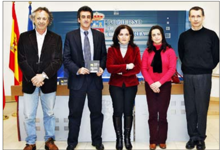
El consejero de Medio Ambiente con personal del observatorio